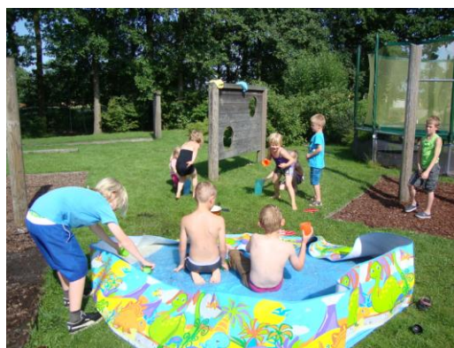
Waterfeest op BSO de Borgh

Hopelijk geeft deze toelichting wat meer begrip voor de achterliggende redenen van de verandering in aanbod. U kunt uw kosten t.o.v. 2011 vergelijken op www.nibud.nl en altijd onze administratie vragen voor informatie of advies. Wordt BSO voor u te onvoordelig, denkt u dan ook eens aan gastouderopvang. Het is een kleinschalige, huiselijke en flexibele opvangvorm, waarbij u uitsluitend de gebruikte opvanguren betaalt. Onze bemiddelingsmedewerkers van het GOB staan voor u klaar om een bij u passende gastouder te zoeken. De kwaliteitseisen voor gastouders zijn verhoogd, en daarmee hebben zij nu verplicht een passende opleiding, naast een EHBO diploma.